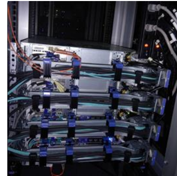
EQUIPOS (Switches, UBR,RF Gateway)