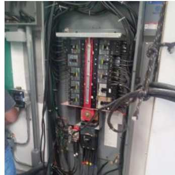
CABLEADO ESTRUCTURADO FO/RF

*Pólizas de mto preventivo y correctivo*