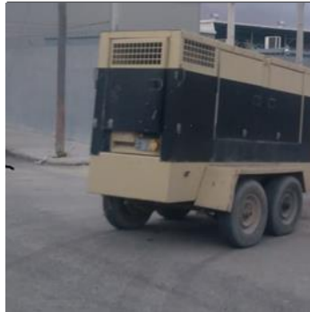
PLANTAS DE DC/AC

*Pólizas de mto preventivo y correctivo*