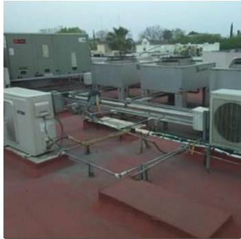
EQUIPOS DE AIRE ACONDICIONADO